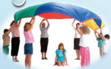
Heilbrigði og velferð/ íþróttir