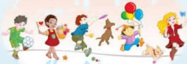
Leikur, gleði, nám