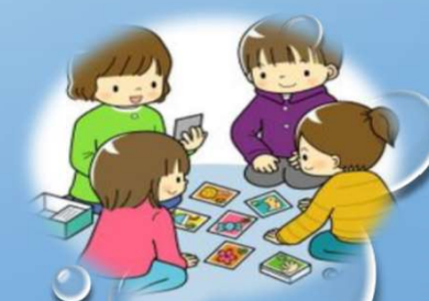
Spil og leikir