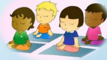
Heilbrigði og velferð/ núvítund