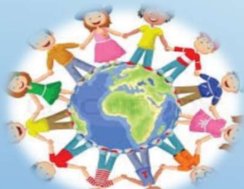
Mannréttindi og lýðræði