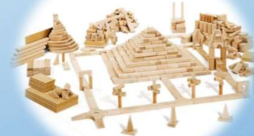
Stærðfræði og rúmshyggja